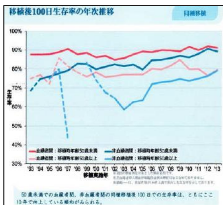
図2(右)：日本造血細胞移植データセンター「2015年度 日本における造血幹細胞移植の実績 11頁」より転載

初回同種移植後の合併症による死亡リスクは2008年以降、1割以下まで低下しております（図1左側）。それを反映して、治療後の生存率はこの15年で改善を認めております（図1右側）。ただし患者さんの年齢・全身状態、原疾患やそのコントロール状態、移植の種類によって治療成績は大きく異なります。