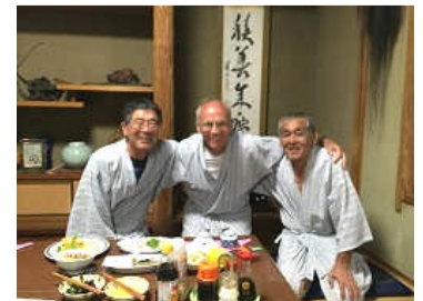
同行4人と 44番後の旅館で (一人は映らず)