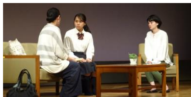
②劇「首のないカマキリ」