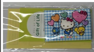
保健所が広報で配布したグッズ