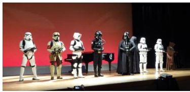
④ダース・バイドも骨髄バンク支援