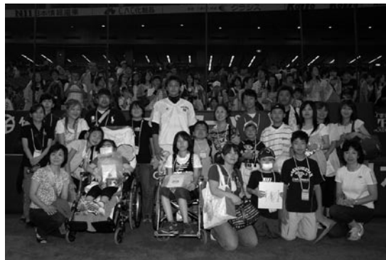
東京ドームに招待された子供たち

子供たちは一様に目を輝かせていました。夢や希望にあふれた表情をしていました。ただし、この日球場に来られた子供たちは、外来で通院中の子や、医師が許可して看護師の付き添いが実現した子など、ほんの一握りの子供です。病室でしか見られない子供が大勢いるのが現状です。球場に来られた子供たちは運がよかったのかもしれませんが、この体験はその後の大きな希望となり、財産となるはずですよ。