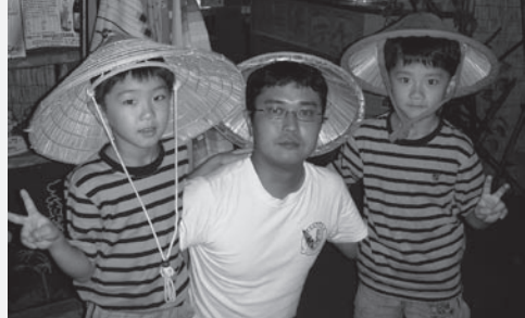
夏休みの家族旅行で

ドナー体験は、大変貴重な経験です。多くの方にこの体験談をお伝えしたいと思います。勝手なもので、普段元気なときには、健康の素晴らしさを理解していないんですね。家族と生活し一生懸命仕事をする。そして飲んで酔っ払って帰ってくる。当たり前と思われている日常生活の中で、健康の素晴らしさを再認識すると共に、「生きるとは何か」を考えました。もし、自分が患者さんだっ