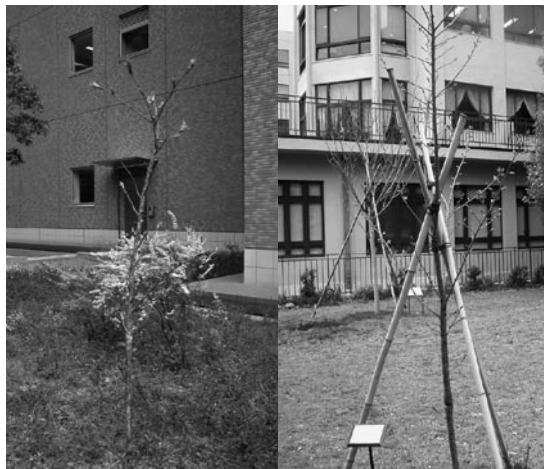
左：医科研新病棟脇の福祿寿、右：聖路加小児病棟前庭の福祿寿

桜の木も子供と同じです。気長に成長を見守っていれば、やがてそれぞれの美しい花を咲かせてくれることでしょう。 (新田恭平)