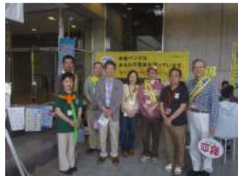
上：県職員、日赤職員、千葉の会員 下：フリマ会場風景

これからは、年配の方には、「娘さん息子さんにお話して頂けますか？」と一言添えて親御さんからお子さんへの登録リレーが出来たらと思った登録会でした。(河口)