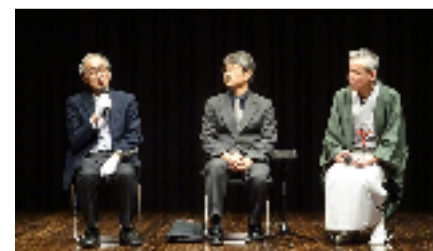
伊庭・後藤さん、右女助師匠のミニトーク