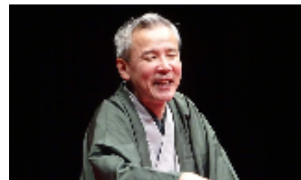
桂右女助師匠の落語