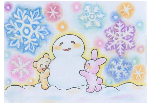
山崎さんイラスト

このような気団のせめぎ合いは、日本列島が大陸と太平洋の境に位置していることが原因となっています。つまり、日本列島そのものが日本特有の四季の変化をつくりだし、さらにはそれが、日本の文化に影響を与えているとも言えるのです。季節ごとの私たちの暮らしは、立春・穀雨・処暑・大寒などの季節変化と密接に関係しています。普段あまり意識することのない私たち自身の考え方や感じ方も、日本列島の自然が関係していると言えるのかもしれない。(H.K.)