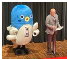
成田市長とうなりくん

最後になりますが、千葉骨髓バンク推進連絡会設立35周年おめでとうございます。皆様の活動により数多くの命がドナー様から患者へつながれたことと存じます。元患者の一人として心より御礼申し上げます。