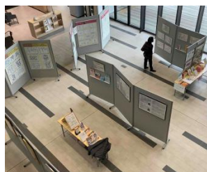
広い展示スペース