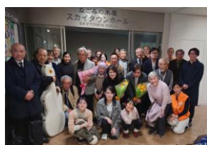
関係者で記念写真