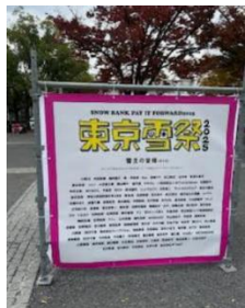
雪主(寄付者)の皆様