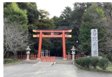
香取神宮にお参りました