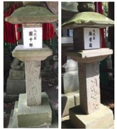
成田屋の奉納した石灯籠

<参考文献: 「謎の漢字」 (笹原宏之著、中公新書)、成田屋 web サイト ( http://www.naritaya.jp/ )> (漢字教育士/萩原匡祐)