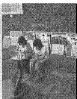
あじさい看護福祉専門学校にて、学校