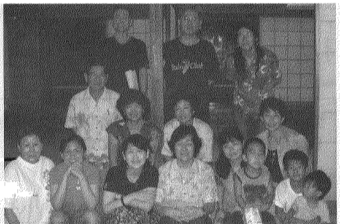
9月後半に新メンバーを出産予定のユルギタさん

の温度差もあり、意見交換が難しい時もあるかと思いましたが、地元の声も上げて行きたいと思