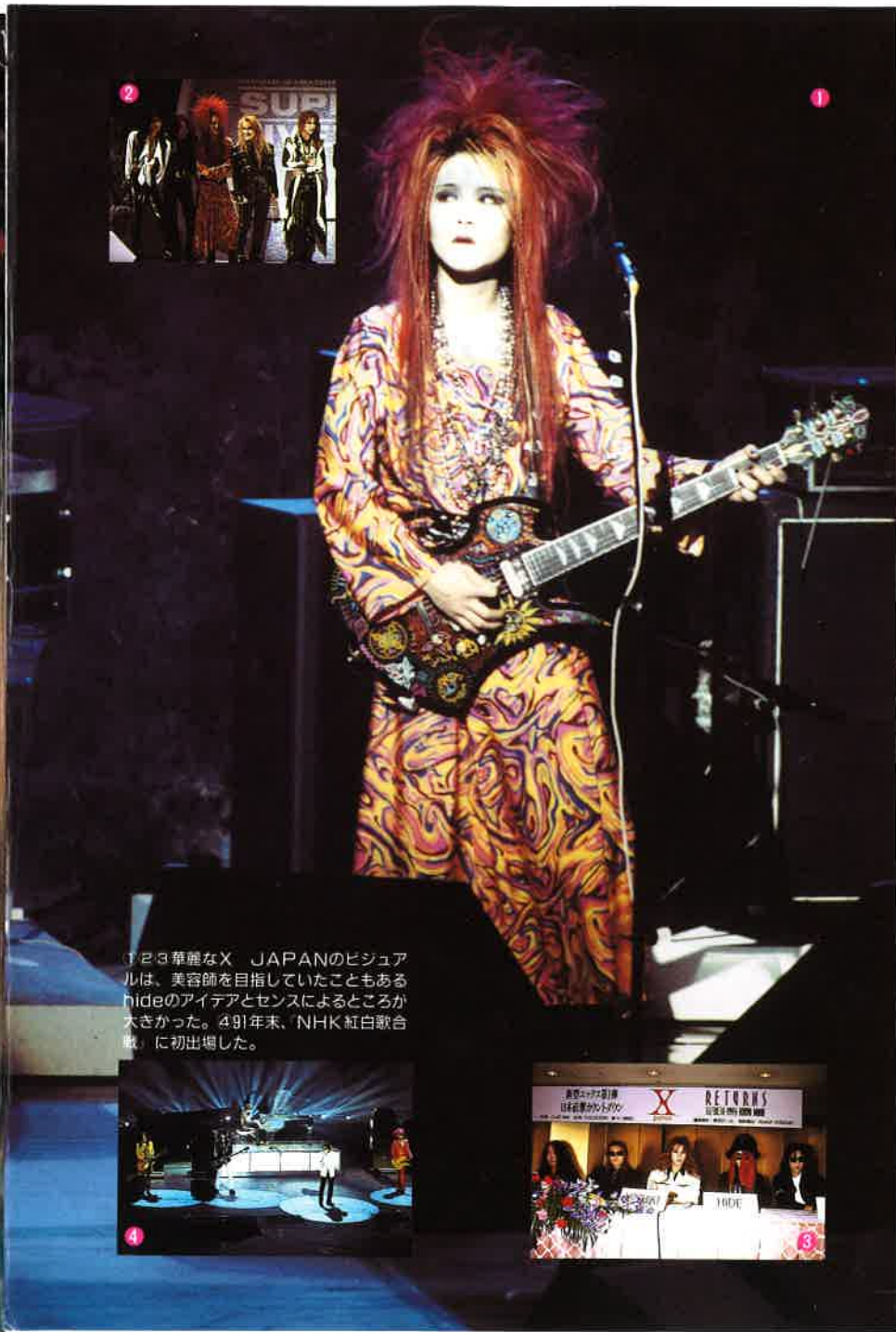
1 2 3 華麗なX JAPANのビジュアルは、美容師を目指していたこともあるhideのアイデアとセンスによるところが大きかった。491年末、NHK紅白歌合戦に初出場した。