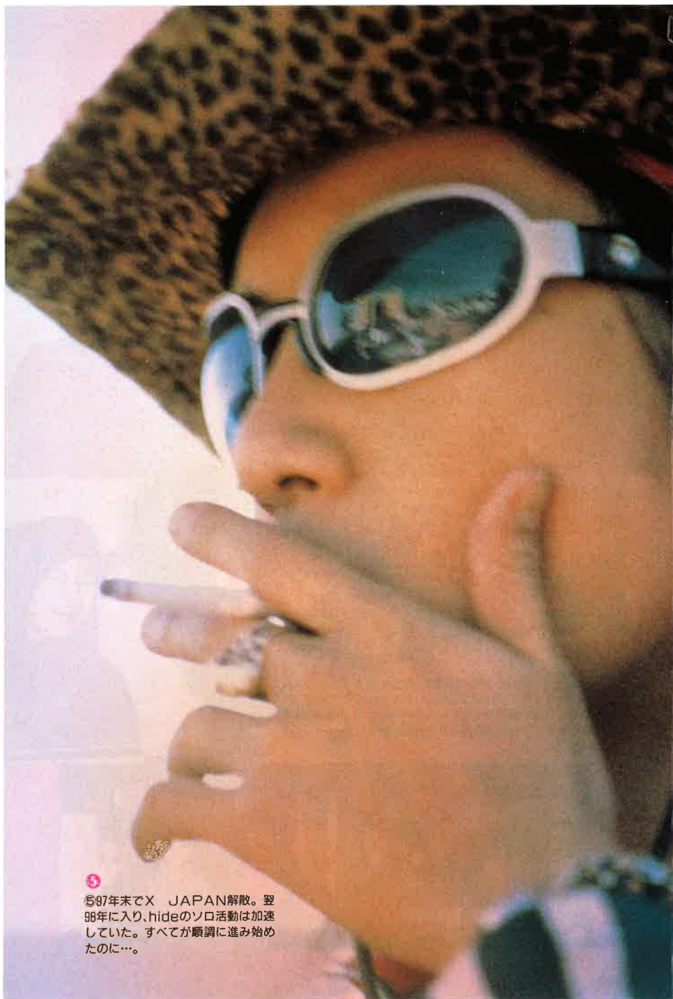
5 97年末でX JAPAN解散。翌98年に入り、hideのソロ活動は加速していた。すべてが順調に進み始めたのに…。